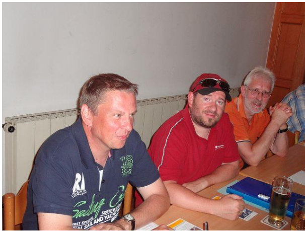
Sportfreunde aus dem Kreis Rottal