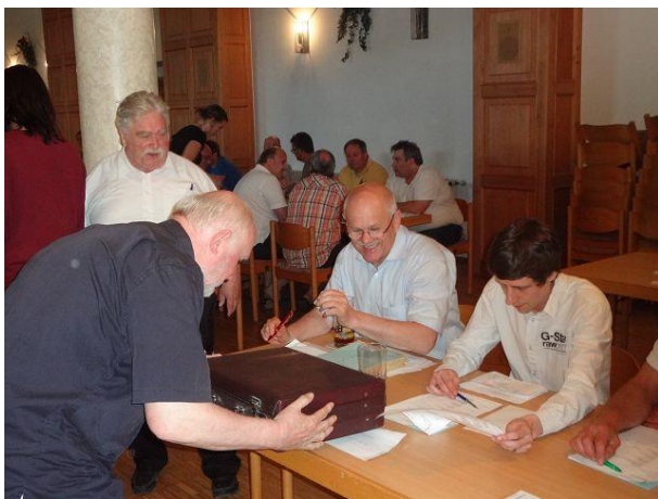
Was unser BFW Vereinsservice da wohl in seinem Koffer hat ?